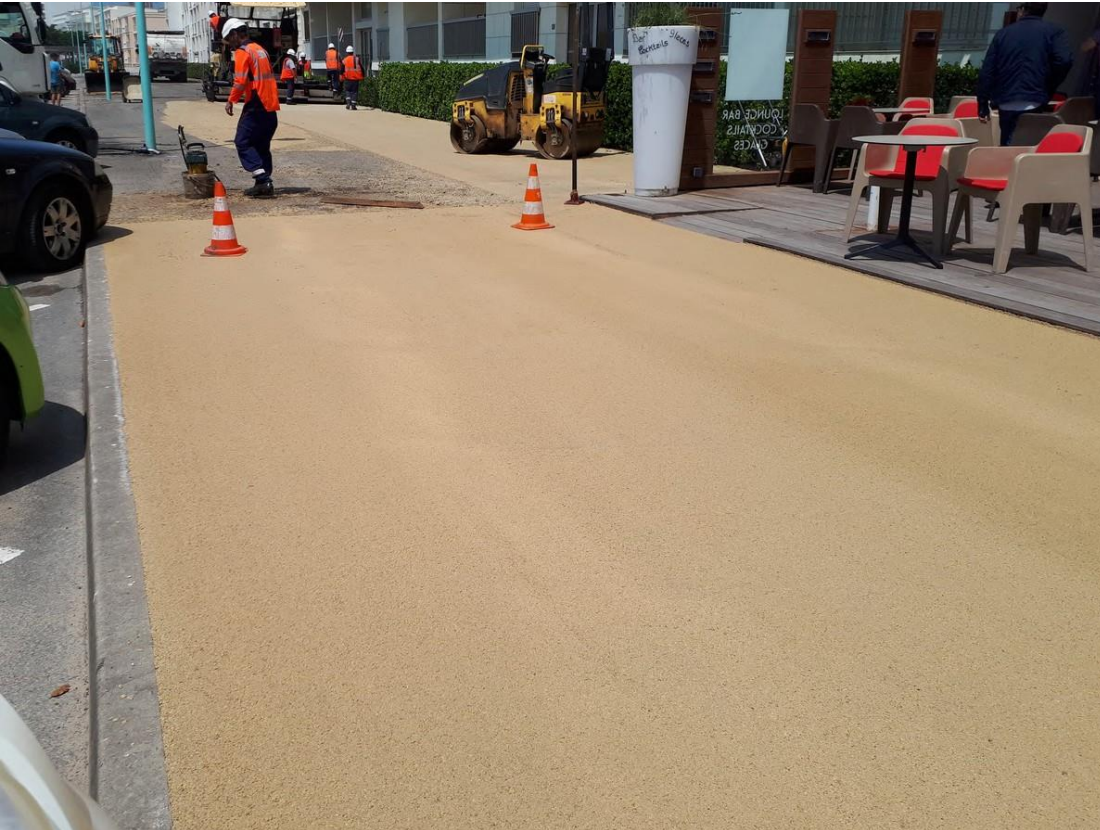
Tarn et Garonne