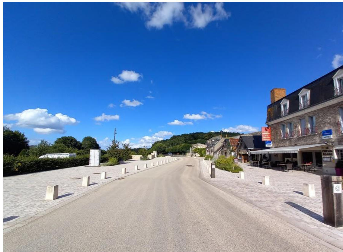
Pays de la Loire